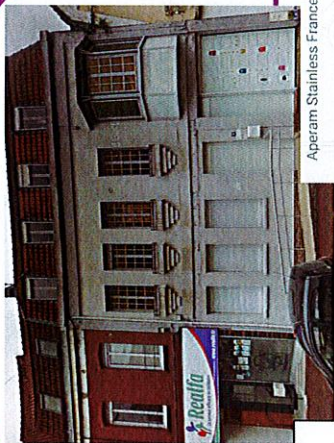
Aperam Stainless France